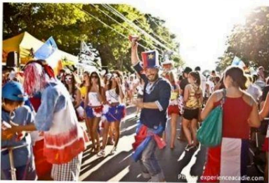
FESTIVAL ACADIEN DE CARAQUET

Il est difficile d'identifier où se trouve l'Acadie . Voici pourquoi !